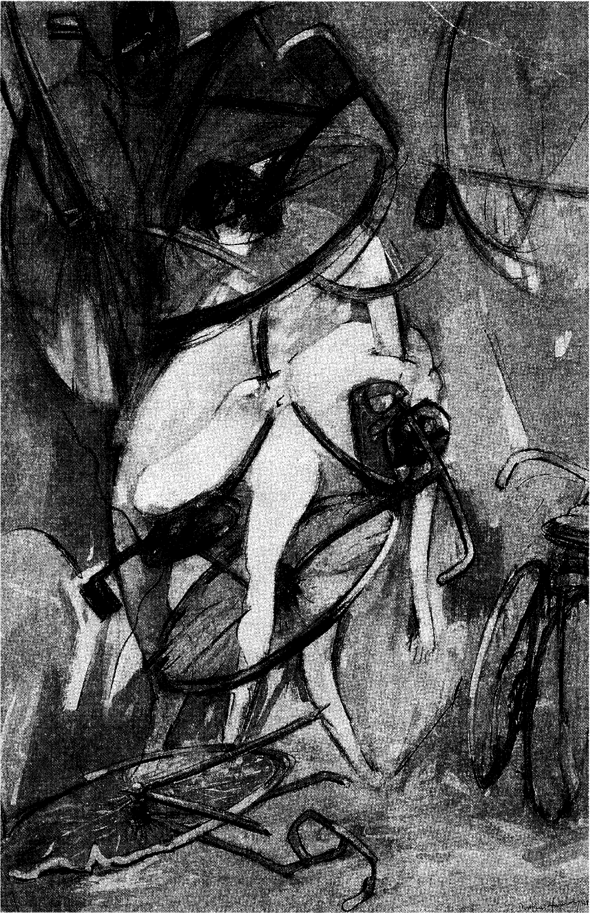
DOROTHEA TANNING: Mellan liv, 1989. Svart krita och goache. 152,5 x 101,5 cm Från utställningen på Malmö Konsthall 3 april–16 maj 1993